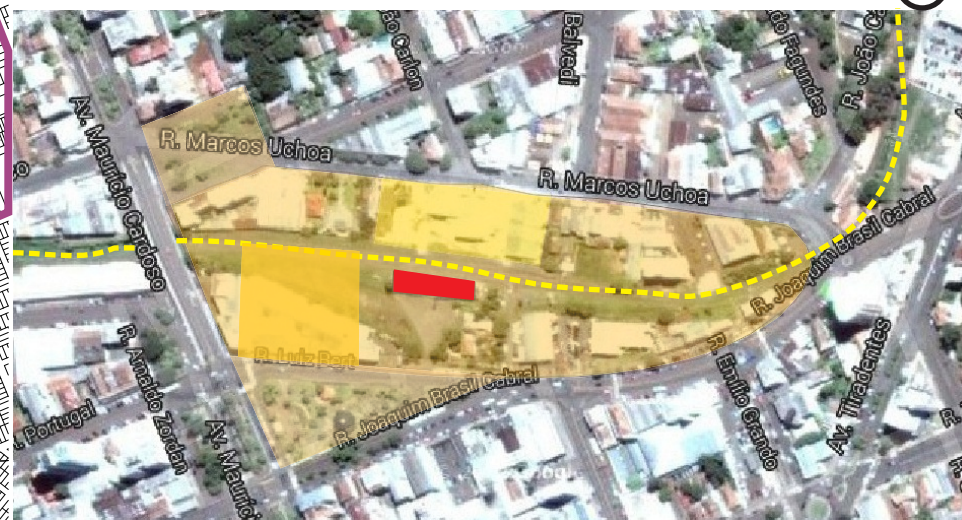
Fig.62- Área recorte

Na planta ao lado existem duas marcações para o centro, o perímetro real e dentro dele a demarcação de sua área mais importante e valorizada, e ali se localiza a área recorte do Marco Zero. É importante perceber que a cidade cresceu mais no sentido dos eixos para automóveis do que ao longo da via férrea, tanto em função do plano urbano que fora concebido nesse sentido em função da topografia ser muito acidentada ao norte, noroeste e nordeste, quanto pelo fato da ferrovia ter sido desativada. A retomada das atividades ferroviárias irá propiciar um crescimento que pode ser previsto e ordenado ao longo da ferrovia tornando-a um novo eixo valorizado na cidade.